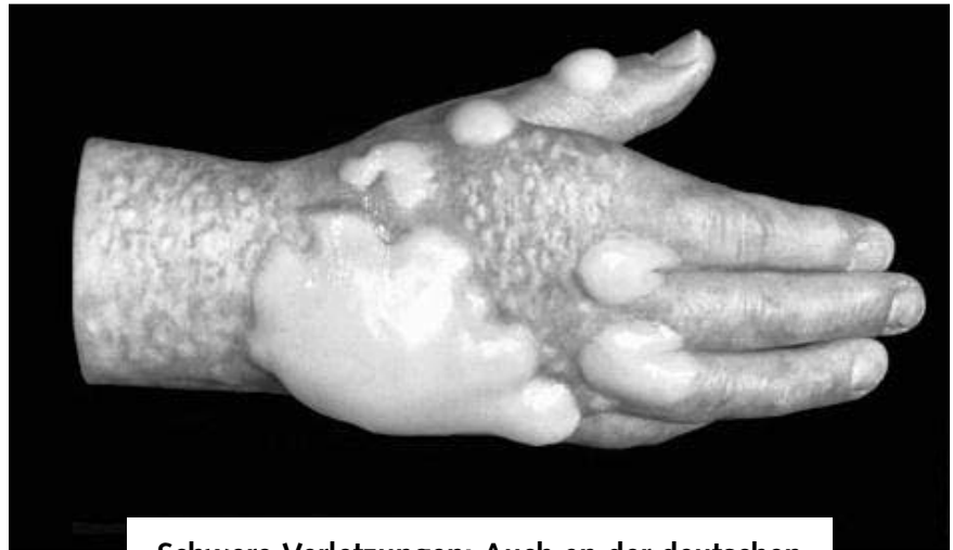
Schwere Verletzungen: Auch an der deutschen Nordseeküste lauert Senfgas auf seine Opfer.

Im Bereich der Jade kam es 1954 zu drei Vorfällen, bei denen mindestens fünf Munitionsfischer durch Senfgas schwer verletzt wurden. Offiziell hieß es, hier könne es sich um Relikte aus dem Ersten Weltkrieg gehandelt haben (4). Diese Behauptung ist zumindest für zwei Vorfälle,