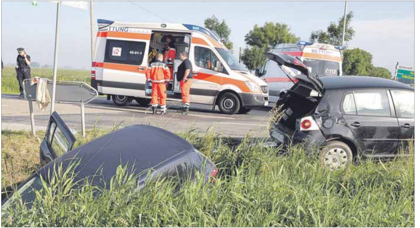
Durch die Wucht des Zusammenstoßes wurde ein Dacia in einen Straßengraben geschleudert. Der Fahrer eines VW Golf hatte den Wagen offenbar nicht bemerkt und ihm die Vorfahrt genommen.

Der Unfallverursacher wurde ins Borromäus-Hospital Leer gebracht. Die Dacia-Fahrerin kam ins Krankenhaus Westerstede. Die Verletzungen aller Beteiligten sind schwer, aber nicht lebensgefährlich, so die Polizei. Der Unfallbereich war gut eine Stunde voll abgesperrt.